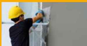
MALTOVÉ SMĚSI A LEPIDLA