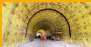
HYDROIZOLACE SPODNÍ STAVBY