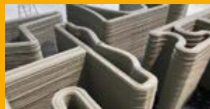
PŘÍŠADY DO BETONU