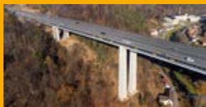
SANACE A OCHRANA KONSTRUKCÍ