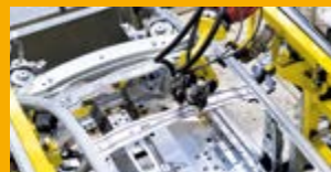
PRŮMYŠLOVÁ LEPIDLA A TMELY