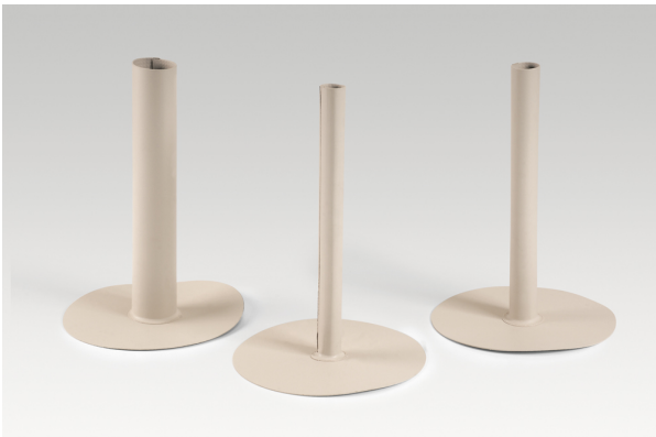
Typ P6 (otevřená trubka)