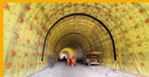
HYDROIZOLACE SPODNÍ STAVBY