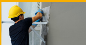
MALTOVÉ SMĚSI A LEPIDLA