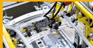
PRŮMYSLOVÁ LEPIDLA A TMELY