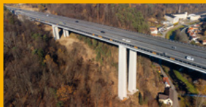
SANACE A OCHRANA KONSTRUKCÍ