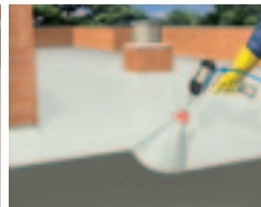
Opravy nebo prodloužení životnosti starých střech.