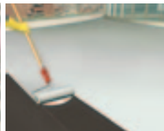
Bílá reflexní barva zvyšuje odrazivost povrchu, zvyšuje energetickou efektivitu objektu.