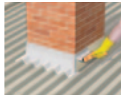
Pro zpracování detailů v kombinaci s jiným hydroizolačním systémem.