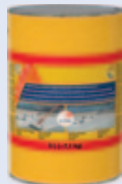
balení: plechovka 5 l

beton, malta, zdivo, cementovláknité desky, střešní tašky, asfaltové nátěry a lepenka, kovy, dřevo, keramická dlažba a obklady