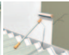
Snadná oprava atiky a dalších konstrukcí