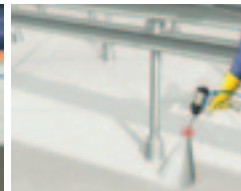
Střechy s mnoha složitými detaily, tvarem nebo omezeným přístupem.