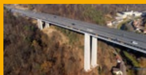
SANACE A OCHRANA KONSTRUKCÍ