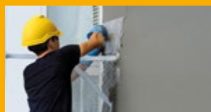
MALTOVÉ SMĚSI A LEPIDLA