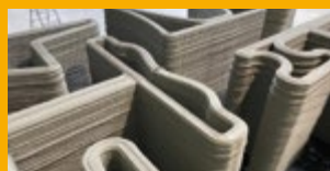
PŘÍSAKY DO BETONU