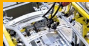
PRŮMYSLOVÁ LEPIDLA A TMELY