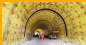
HYDROIZOLACE SPODNÍ STAVBY