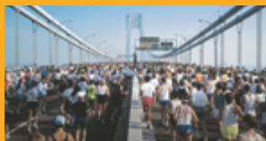
SANACE A OCHRANA BETONU