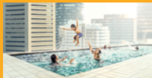
LEPENÍ A TMELENÍ