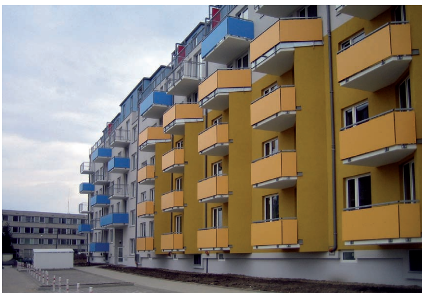
Opravné malty Sika MonoTop® pro strojní i ruční zpracování vyhovují sanační normě ČSN EN 1504