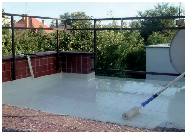
Trvale pružný polyuretanový nátěr Sikafloor®-400 N Elastic