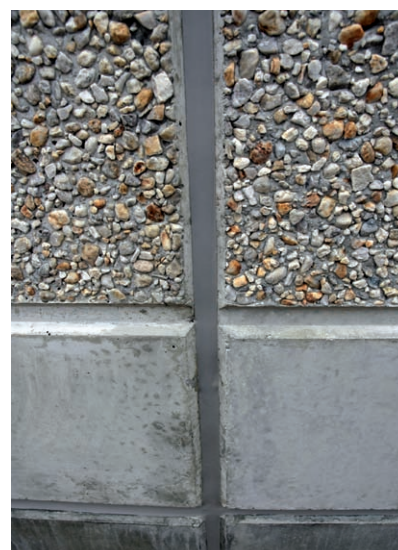
Tmely Sikaflex® splňují nejvyšší požadavky na kvalitu a současně na nezávadnost použití