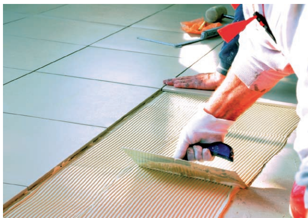
SikaBond®-T8 – materiál pro hydroizolaci a přilepení dlažby

Rekonstrukce interiéru je velmi často spojena s výměnou podlahové krytiny. V této oblasti je společnost Sika velice aktivní a nabízí řešení jak pro lokální sanace podkladu podlahy, produkty pro následné vyrovnání povrchu, tak lepidla pro lepení samotných podlahových krytin. Dokážeme si poradit s trhlinami, jejich spojením a vyplněním epoxidovými pryskyřicemi Sikadur® nebo Sikafloor® . Vyrovnání povrchu pod podlahovou krytinou je možné pomocí samonivelačních stěrek Sika® Level . V sortimentu máme lepidla SikaBond® pro lepení měkkých krytin jako je linoleum, marmoleum, korek, koberec apod. Dále pak špičková polyuretanová lepidla SikaBond® pro dřevěné nebo laminátové podlahy i včetně unikátního systému pro tlumení odraženého a kročejového hluku – Sika® AcouBond® System – který s minimálním