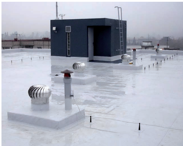
Rekonstrukce střechy PVC hydroizolačními pásy Sikaplan®