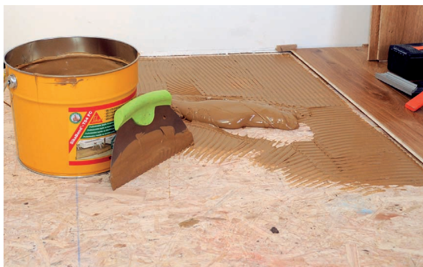
Polyuretanové lepidlo SikaBond® pro dřevěné nebo laminátové podlahy

Vidíte, že záběr společnosti Sika je velmi široký, a proto nás neváhejte kontaktovat i s dalšími požadavky na řešení v oblasti stavební chemie a materiálů. □